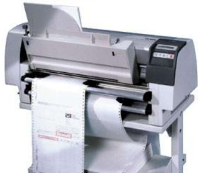
PP806 avec option piédestal et bac feuille à feuille