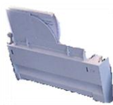
Chargeur Feuille à Feuille