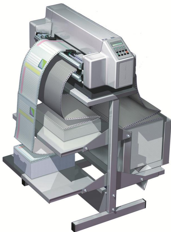
PP407 avec option piédestal